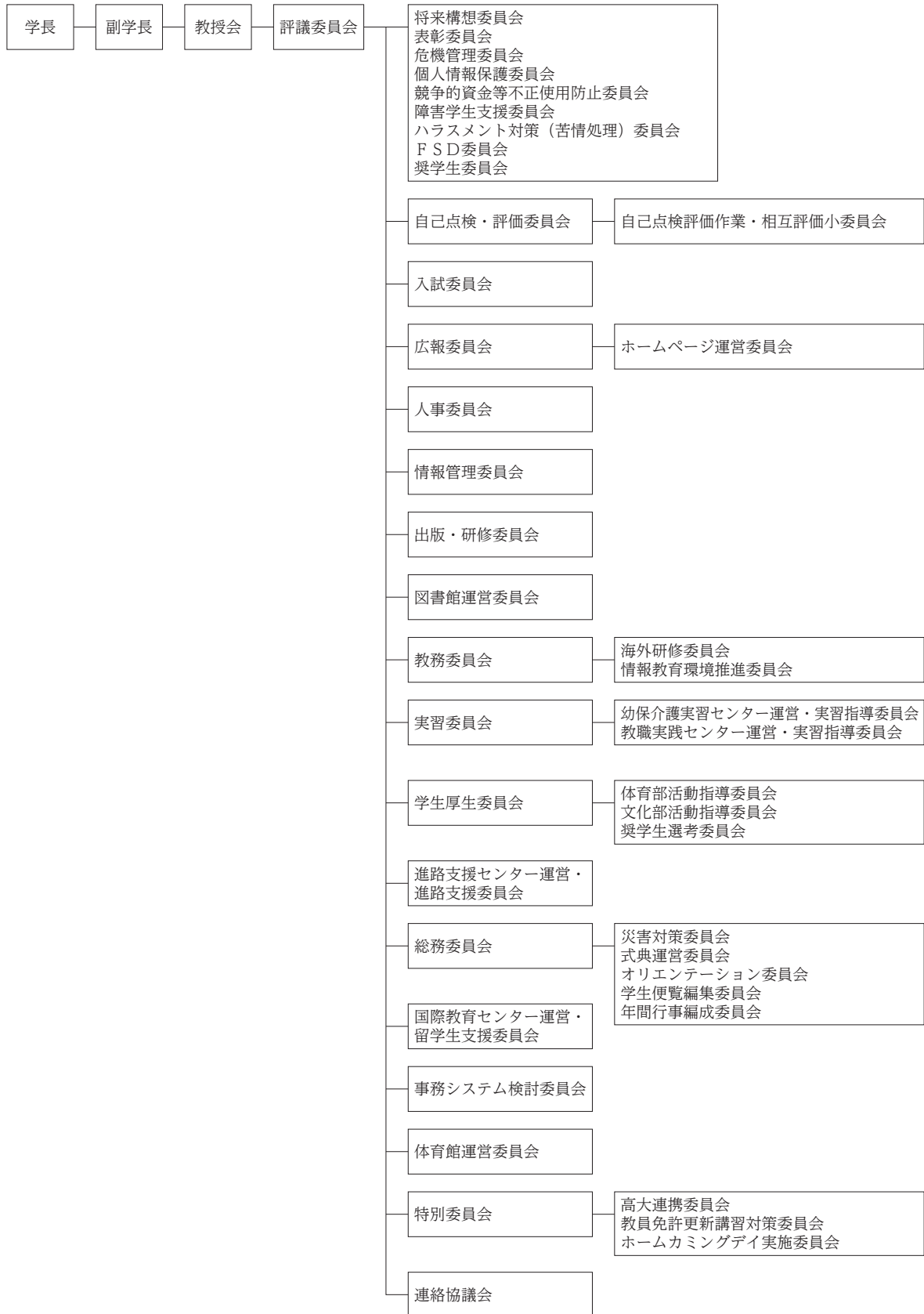
【図3-3-1】 東北文教大学 平成28年度委員会組織図